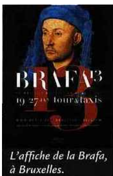
L'affiche de la Brafab, à Bruxelles.

BRUXELLES (Belgique) 19-27 janvier. Dixième édition