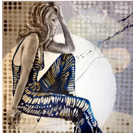
CECILE DESSERLE Vintage Vanity N°13, technique mixte sur toile, 100x100 cm Galerie Nicole Gogat - Aigues-Mortes