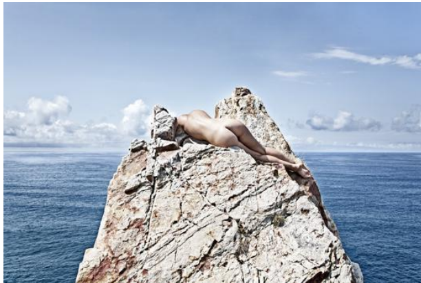
PELAYO ZURRON El paraiso desnudo, 2012 Galerie Gaudi - Madrid