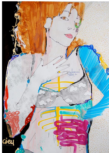
CIEU Sur les plages faites qu'elle veuille m'épouser, 2012 Huile Acrylique et encre sur papier, 65x50 cm Galerie Envie d'art - Paris - Londres Courtesy Cieu