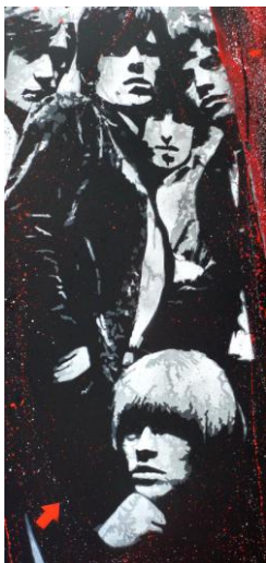
JEF AEROSOL Rolling Stones, 2012 Pochoirs sur carton, 87x180cm Xin Art - Ars en Ré - La Rochelle

◆ Ce programme, digne d'une grande foire internationale, réservé à 300 VIP, se déroulera dans une ambiance décontractée et conviviale.