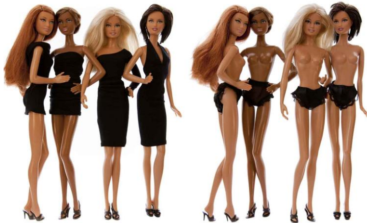
CECILE PLAISANCE 4x4 culottes Photographie sous diasec, 3 exemplaires, 120x180 cm Galerie K + Y - Paris

◆ Une caravane Airstream installée à l'entrée de la foire proposera des ateliers artistiques aux enfants de 4 à 12 ans le samedi 12 et le dimanche 13 janvier 2013.