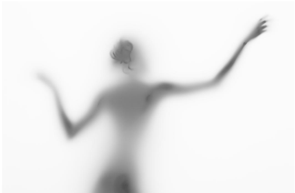
ERIC CECCARINI Photographie Série Amnios, 2001 Doinel Gallery – Londres