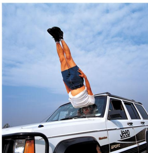
LI WEI Li Wei falls to the Car, 2003 Photographie, 150x150 cm Galerie Dock Sud - Sète

○ Le NEW collectionneur : "Le boudoir du collectionneur" dévoile une dizaine d'œuvres phares de la collection d'art urbain de Nicolas Laugero Lasserre.