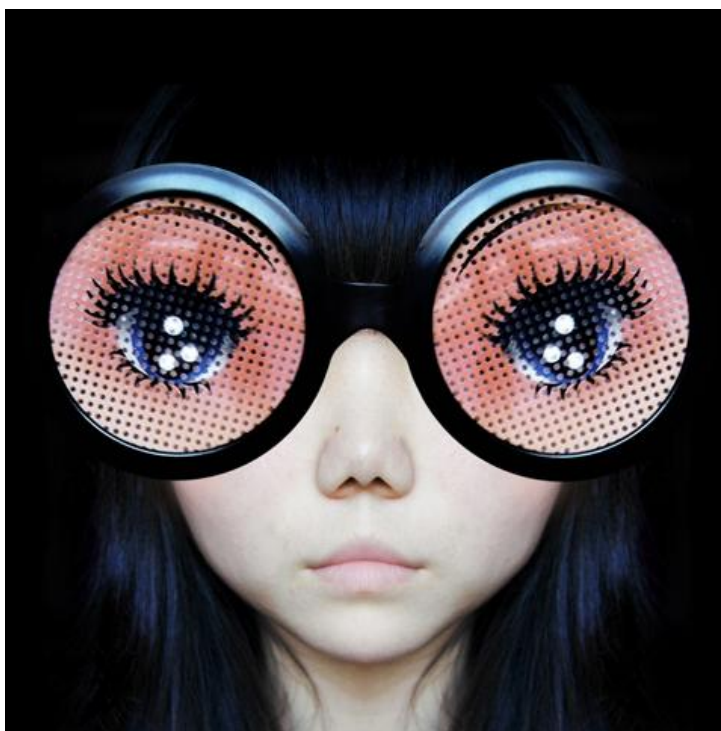
ANH SUN MI Choloncholon Photographie, pièce unique, 150x150 cm Visionairs Gallery Paris, Hong-Kong, Singapour

Tout est nouveau : son concept pensé pour les acheteurs, sa programmation internationale (30 galeries) et ses services innovants.