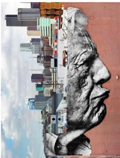
J.R. The wrinkles of the city, Los Angeles-Robert Upside Down, Downtown, USA, 2011 Photographie en couleur, plexiglas, aluminium, sur bois. Edition 3/3 plus 2AP.165 x 125 cm. Galerie Emmanuel Perrotin - Paris